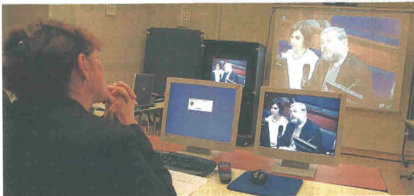
Le portail internet conçu par le syndicat interhospitalier des télécommunications de santé, avec l'association Planet santé, a été présenté, hier, en visioconférence entre Nantes et Angers.

Messagerie gratuite sécurisée, partage en ligne du dossier de patients... Un nouvel outil internet veut faciliter les relations entre les professionnels de la santé dans la région.